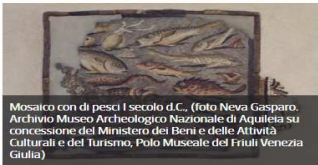
Mosaico con di pesci I secolo d.C.