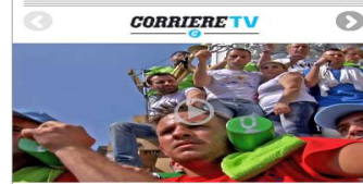
Un patrimonio sulle spalle