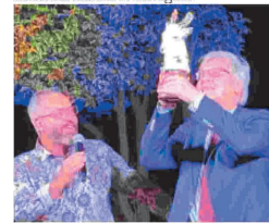
Con Vittorio Sgarbi sul palco per il premio «Pio Alferano» nell'agosto del 2023